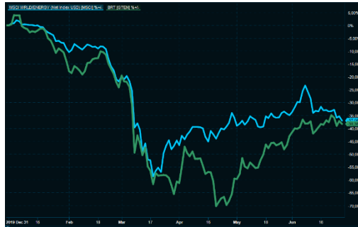
MSCI World Energi (blå), Brent spot (grønn)

Oslo Børs er inne i en svak periode relativt til andre børser, til tross for at oljeprisen i det siste har etablert seg godt over 40 dollar/fatet. Sist uke falt Oslo Børs 2,5% og det er bare den Brasilbørsen som var svakere av de vi følger, målt i NOK. Sist måned er Oslo Børs ned 1,3%, mens f.eks. Stockholmsbørsen er opp 3,3%, verdensindeksen er opp 2,8% og vekstmarkedsindeksen er opp hele 8,2%, alt målt i NOK. En stor del av forklaringen er den svake utviklingen for energirelaterte aksjer som er ned 5% (i NOK) i en periode hvor oljeprisen er opp 20% (i USD). Vi venter at denne trenden vil reverseres når oljemarkedene gradvis balanseres og oljelagrene trolig faller i ukene og månedene som kommer.